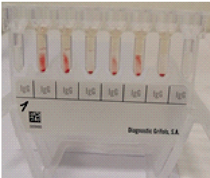
Рис.3. Сравнительный гелевый тест с использованием тест-эритроцитов из панели варианта исполнения №7 производства ООО «Сангвитест» и ID-Dia Panel производства BioRad: - микропробирки №2, 3, 4 – Тест-эритроциты I, II, III из варианта исполнения №7 производства ООО «Сангвитест»; - микропробирки №5, 6, 7 - Тест-эритроциты I, II, III из ID-Dia Panel производства BioRad. Анализируемый образец: сыворотка пациента, содержащая анти-DiGg антиэритроцитарные антитела.